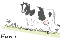
Een koe in de wei .

Soms kun je een woord met ei en ij schrijven. Ze klinken hetzelfde, maar ze betekenen wat anders.