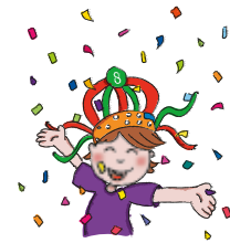
tijdens het feest