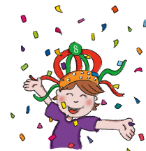
tijdens het feest